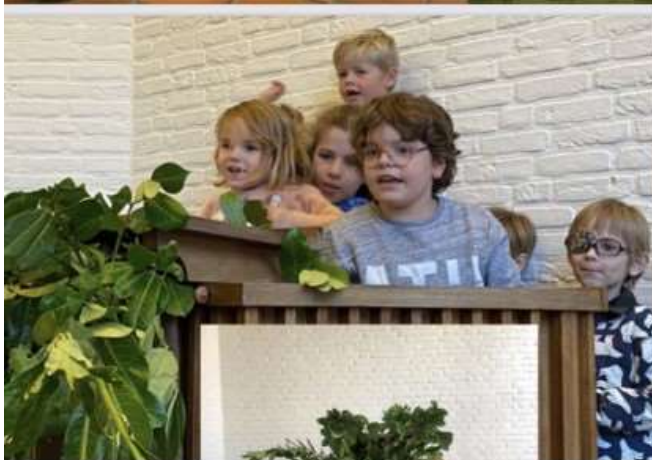
De boom van Zacheüs