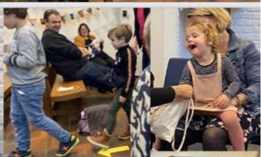
Samen eten en drinken na afloop