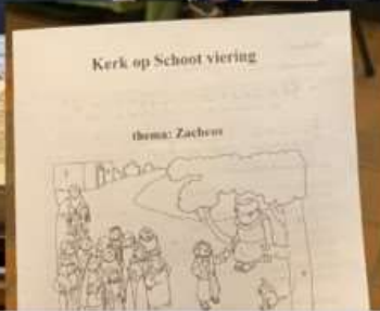
Dominee Beer komt bij alle kinderen langs