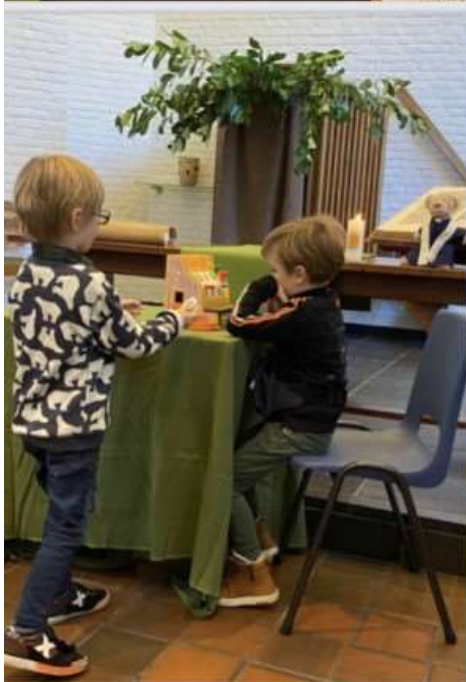
Je chocolade geld inleveren... gelukkig kregen ze het later weer terug