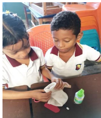
Handpoppen maken in de klas van Liceo San Bernardo, Colombia